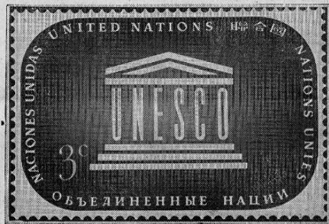
Una reproducción fotográfica del nuevo sello postal de las Naciones Unidas que saldrá a la luz pública el 11 de mayo próximo. La nueva emisión está dedicada a la labor de la Organización de las Naciones Unidas para la Educación, la Ciencia y la Cultura (Unesco). El diseño es obra del señor George Hamori, de Israel. La nueva emisión consistirá de sellos de dos valores: uno de tres centavos, en color morado; y el otro de ocho centavos, en color azul.